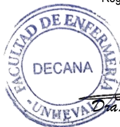
Dra. Enit Ida Villar Carbajal DECANA

DISTRIBUCIÓN: Dir. Investig./Asesor/Solicitante/Archivo