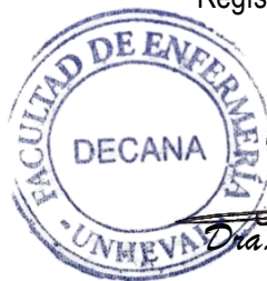
Dra. Enit Ida Villar Carbajal DECANA

DISTRIBUCIÓN: Dir. Investig./Asesor/Solicitantes/Archivo