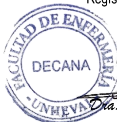
Dña. Enit Ida Villar Carbajal DECANA

DISTRIBUCIÓN: Dir. Investig./Asesor/Solicitantes/Archivo