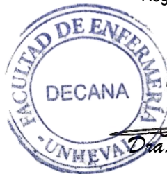
Dra. Enit Ida Villar Carbajal DECANA

DISTRIBUCIÓN Docentes/ Interesados/ Archivo